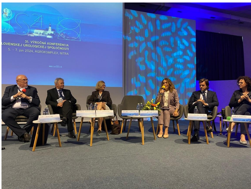
Panelová diskusia venovaná pripravovanému skríningu karcinómu prostaty na Slovensku.