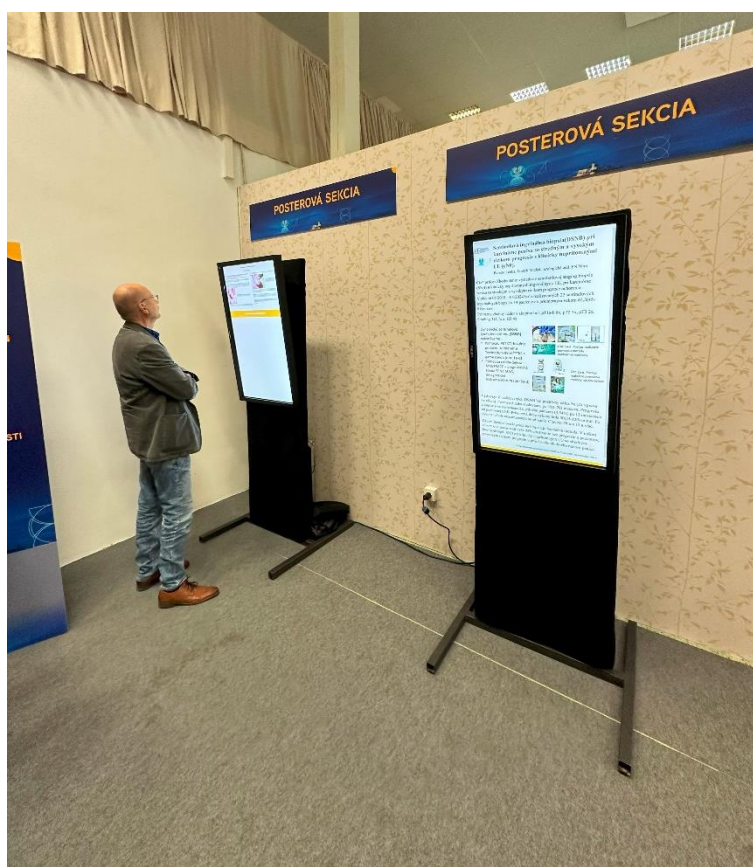
Posterova sekcia počas 31. Výročnej konferencie SUS v Nitre.