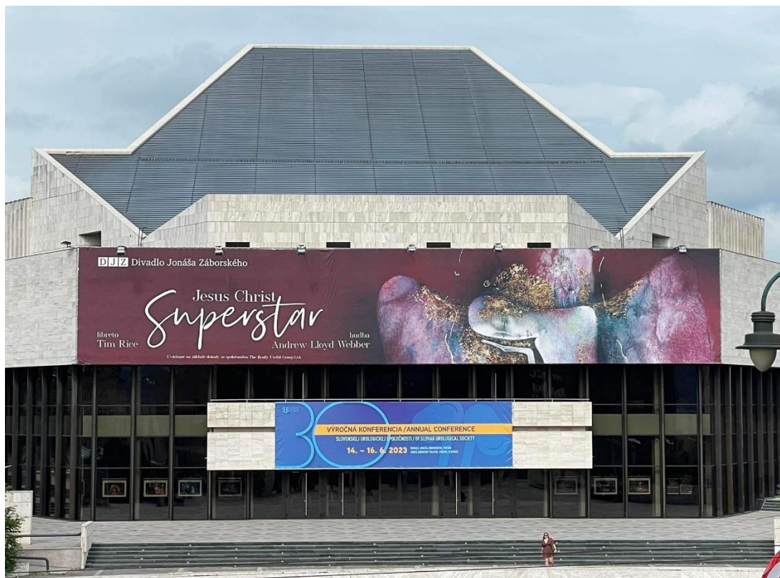
Divadlo Jonáša Záborského v Prešove – miesto konania 30. výročnej konferencie SUS.