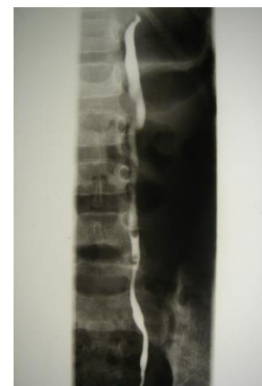
Cystoskopia, sondáž ektopického ústia, retrográdna ureterografia vľavo močovodu horného segmentu