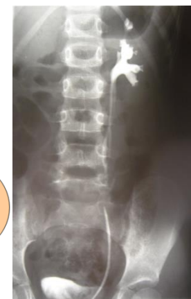
Cystoskopia, sondáž ľavého ústia, retrográdna ureteropyelografia, vľavo ureter fissus dolného segmentu